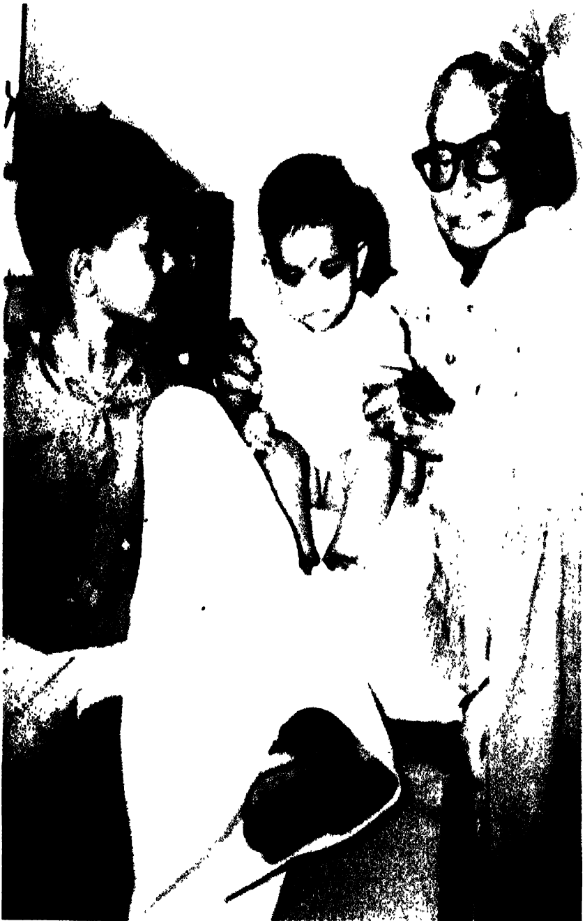
अपने पौत्र और पौत्रियों की साथ